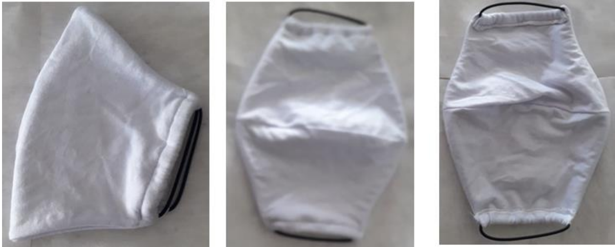
Figura 02: Foto modelo da máscara. Fonte: Ficha Técnica NTCPE 2020.