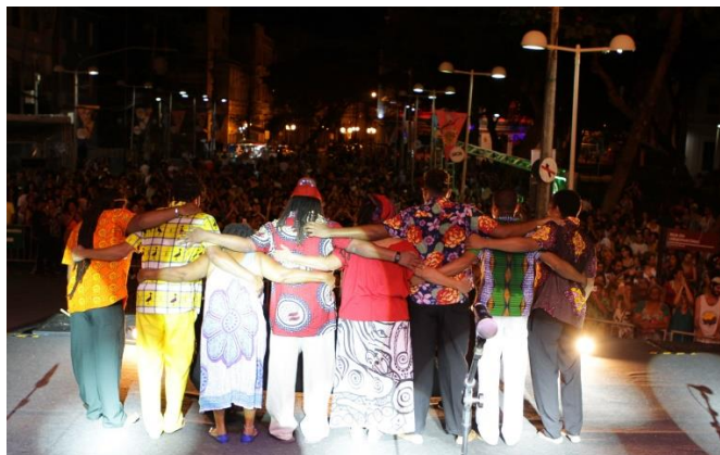
Grupo Bongar e Beth de Oxum