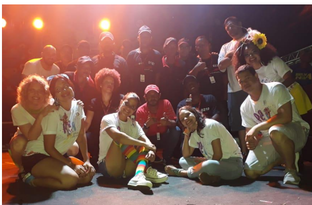
Equipe de Trabalho (SETUREL e Prestadores de Serviço)