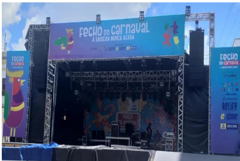
Palco do Evento