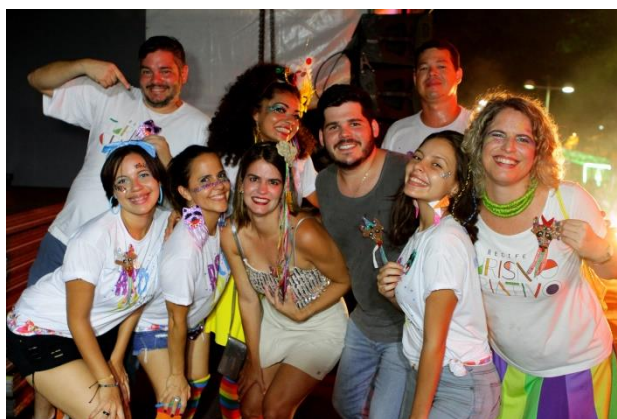
Equipe da Gerência Geral de Inovação Turística/SETUREL