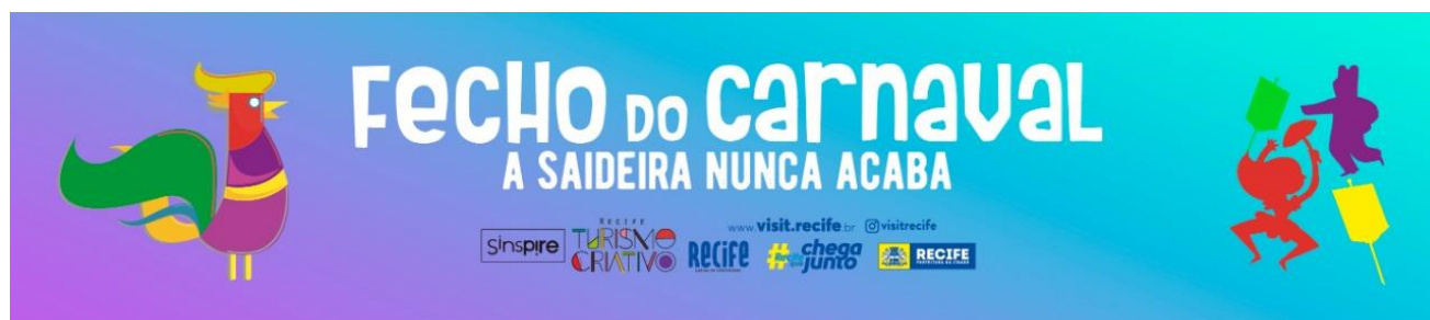
Testeira de palco