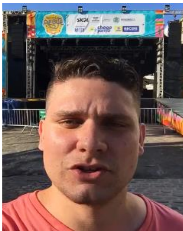
JV- Coletivo Revêrse