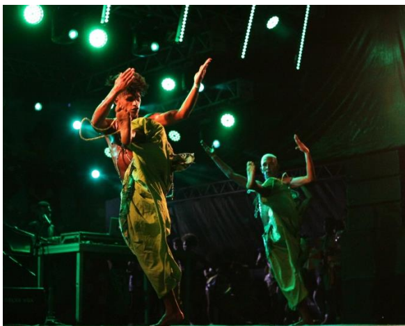
Espectáculo CLOSE: cena África