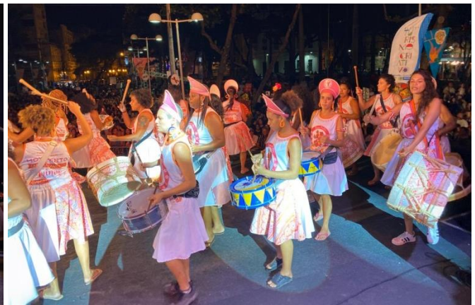
Maracatu Baque Mulher