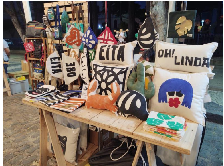
Feira Na Laje