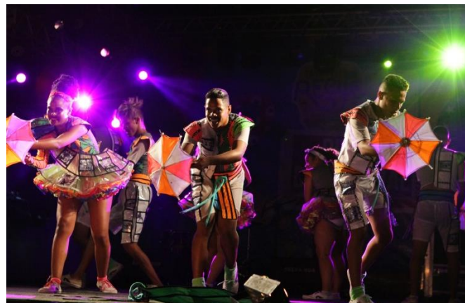
Espectáculo CLOSE: cena Nordeste