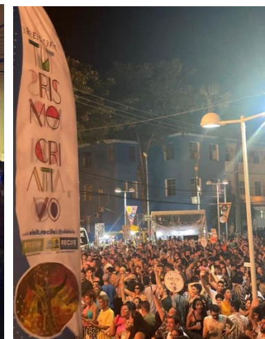
Público do Evento