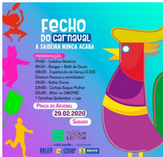
Card de divulgação