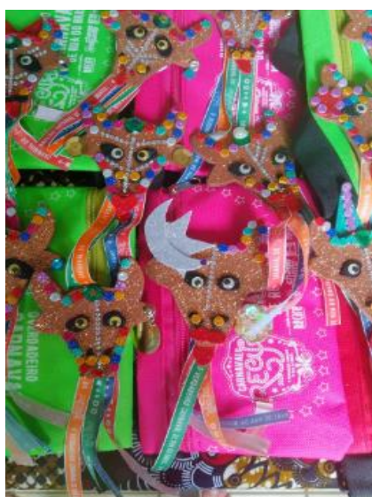
Brindes criativos entregues aos artistas