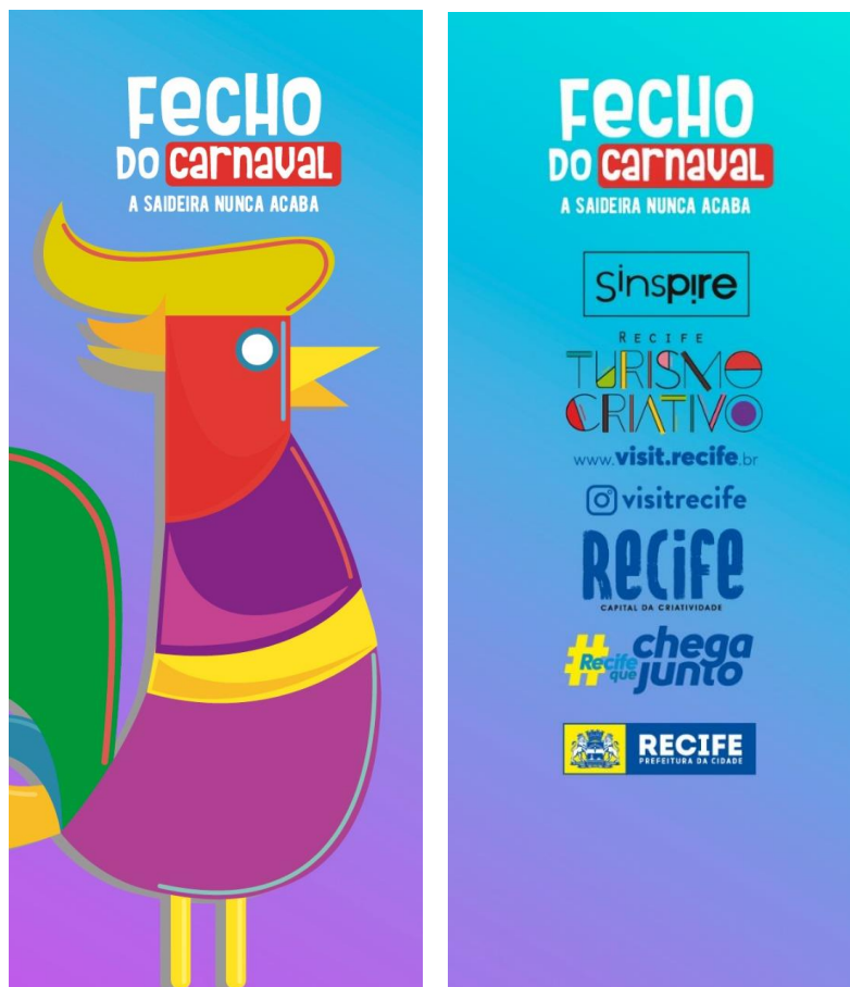
Orelhas de palco (1 e 2)