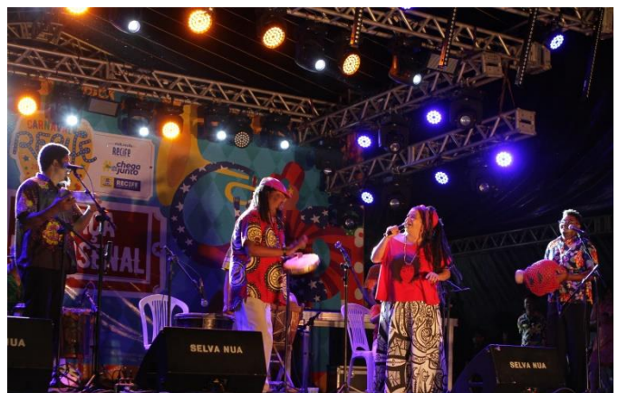
Grupo Bongar e Beth de Oxum