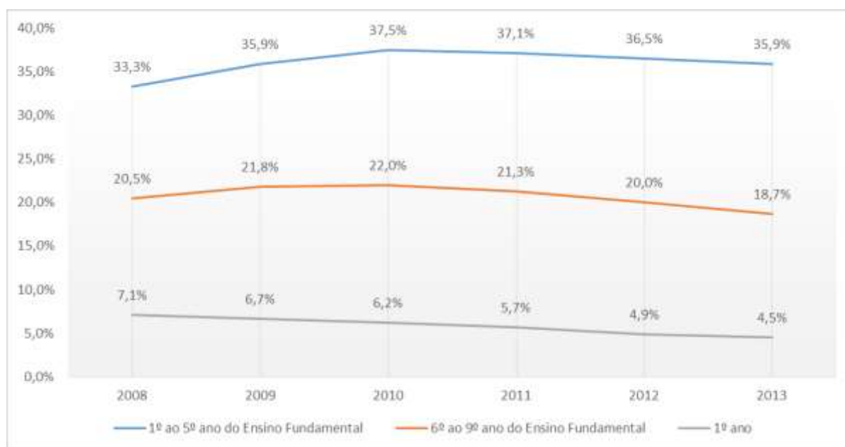
Figura 1: Taxa de distorção idade-ano nas escolas municipais de Recife 2008-2013

Em 2013, a distorção idade-ano foi de 18,7% e 35,9% para os anos iniciais e finais do Ensino Fundamental, respectivamente. Por trás desse cenário, além das taxas de reprovação, está o fato de que parte dos alunos já chegam à escola com idade superior à ideal (Figura 1).