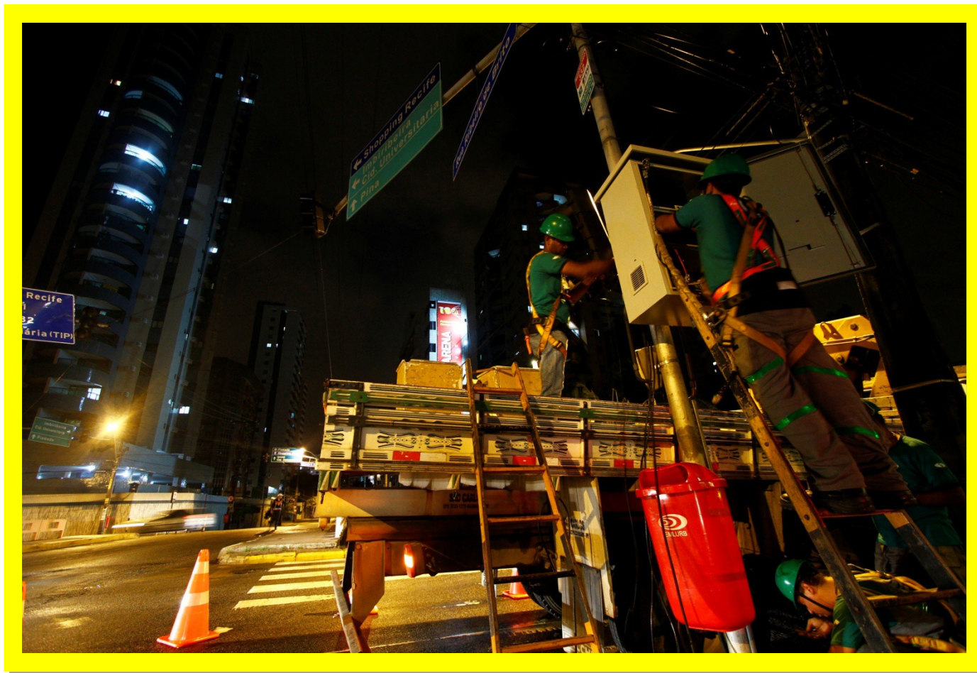
Instalação de No break