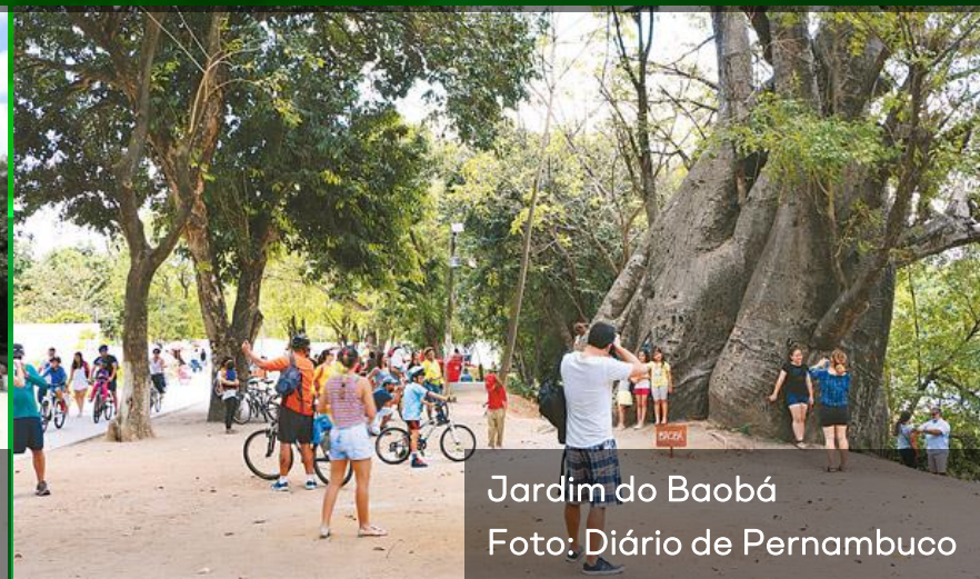
Jardim do Baobá