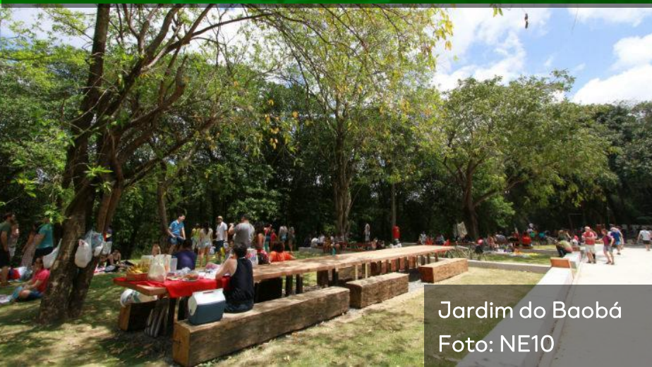
Jardim do Baobá