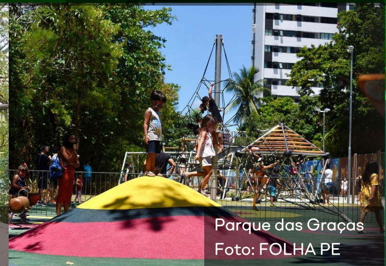
Parque das Graças