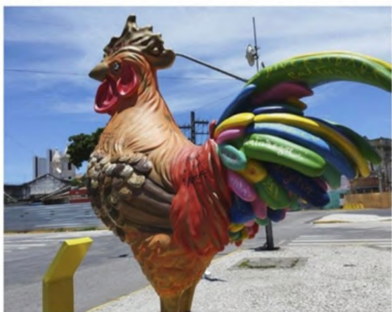
Escultura do projeto "Rota do Galo Criativo", na Praça Sérgio Loreto