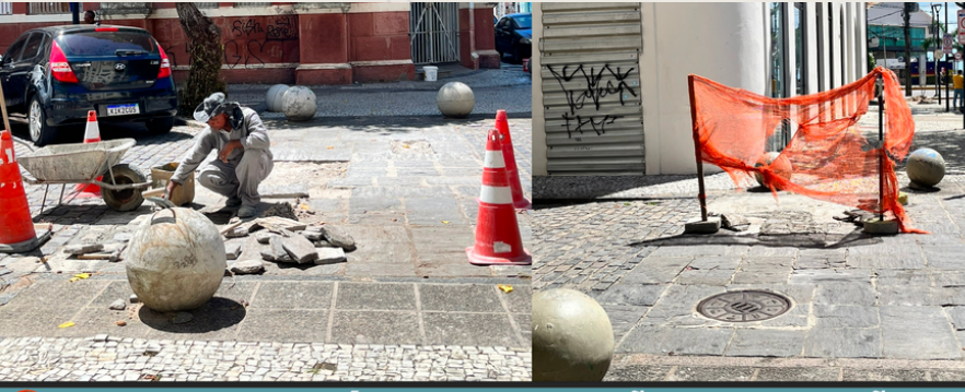
RUA DONA MARIA CÉSAR - PAVIMENTAÇÃO (PEDRA RACHÃO)

O Programa Recentro, através da EMLURB, possui 17 intervenções de zeladoria, entre drenagens, limpeza urbana, passeios e pavimentações em andamento nos Bairros do Recife, Santo Antônio e São José. Ao todo, são mais de 80 intervenções concluídas e entregues no Centro, sempre em conformidade com as demandas recebidas dos atores estratégicos que atuam no Centro.