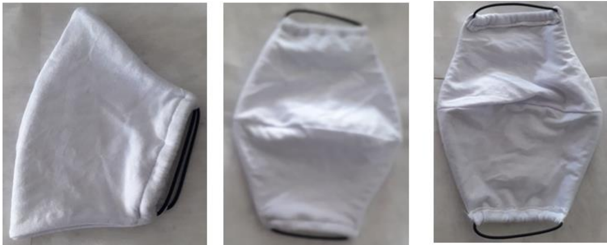
Figura 02: Foto modelo da máscara.

MARCELO GASTON GEREANTE GERAL ADMINISTRATIVO FINANCEIRO